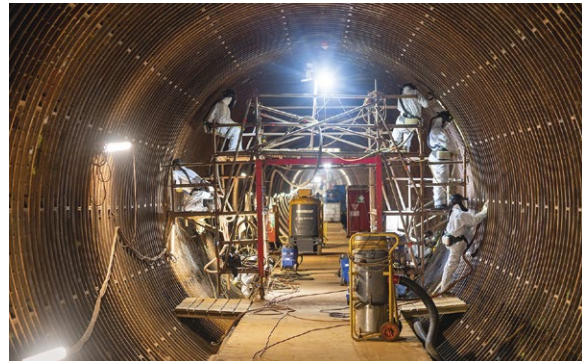
Projekt: Grundinstandsetzung St.-Pauli-Elbtunnel Ingenieurbüros: Ingenieurgesellschaft von Lieberman mbH, Böger + Jäckle Gesellschaft Beratender Ingenieure, Wulff + Partner Ingenieurgesellschaft mbH

Die Angebote tragen jeweils die Handschrift der durchführenden Büros: