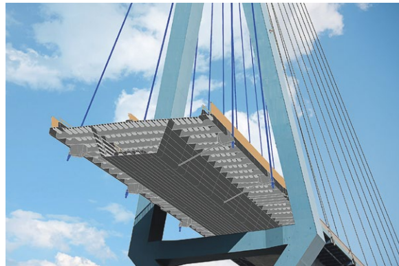
Aktion für Kinder und Jugendliche: Brücken – verstehen, planen, erleben veranstaltendes Ingenieurbüro: WTM Engineers GmbH